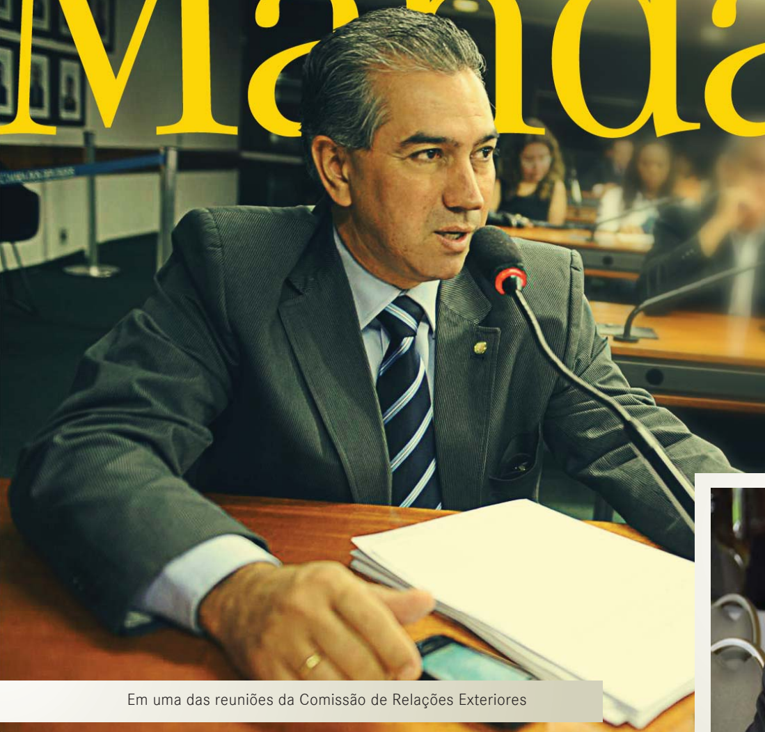
Em uma das reuniões da Comissão de Relações Exteriores