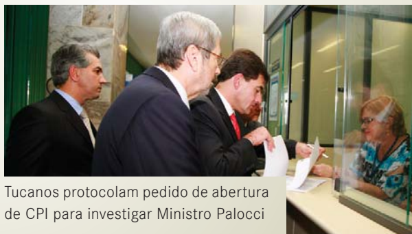
Tucanos protocolam pedido de abertura de CPI para investigar Ministro Palocci