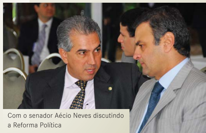
Com o senador Aécio Neves discutindo a Reforma Política